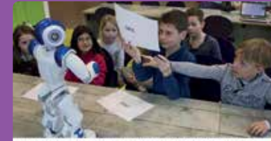
Basisscholen in Helmond experimenteren met 'onderwijsrobot' (video) HELMOND - Mande en zijn collega Gligje zijn de twee robots voor de Helmondse schoolorganisatie Gligj Prima! sinds kort mee experimenteren. Gligj wil kijken wat e...